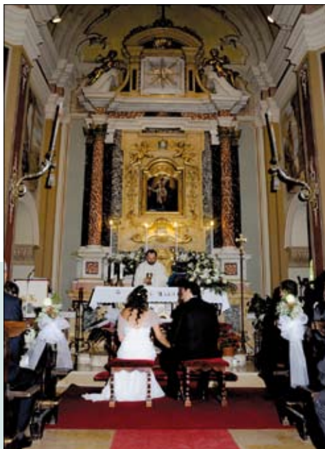
Domenica 6 luglio 2008 ore 12.00 Matrimonio di Nadia e Daniele