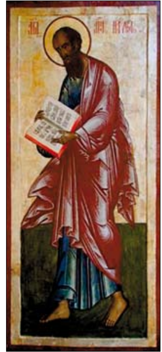
Basilica di San Paolo fuori le mura a Roma

anche noi possiamo incontrare Cristo, nella lettura della Sacra Scrittura, nella preghiera, nella vita liturgica della Chiesa. Possiamo toccare il cuore di Cristo e sentire che Egli tocca il nostro. Solo in questa relazione personale con Cristo, solo in questo incontro con il Risorto diventiamo realmente cristiani. E così si apre la nostra ragione, si apre tutta la saggezza di Cristo e tutta la ricchezza della verità. Quindi preghiamo il Signore perché ci illumini, perché ci doni nel nostro mondo l'incontro con la sua presenza: e così ci dia una fede vivace, un cuore aperto, una grande carità per tutti, capace di rinnovare il mondo.