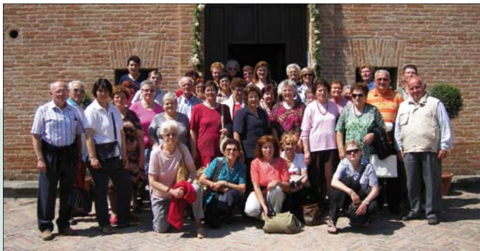
Pellegrinaggio da Morsano al Tagliamento (Pordenone)