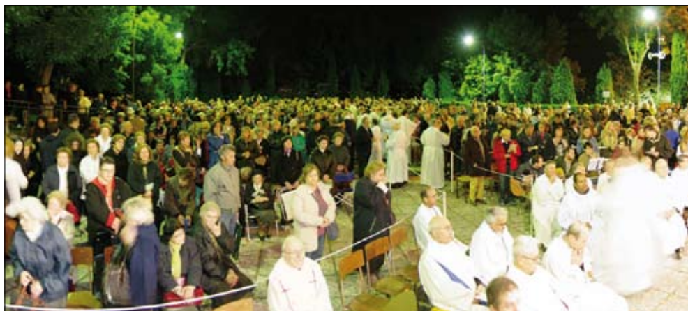
13 maggio 2008 ore 21 - Apertura della Causa di Beatificazione e Canonizzazione del Servo di Dio P. Raffaele Spallanzani