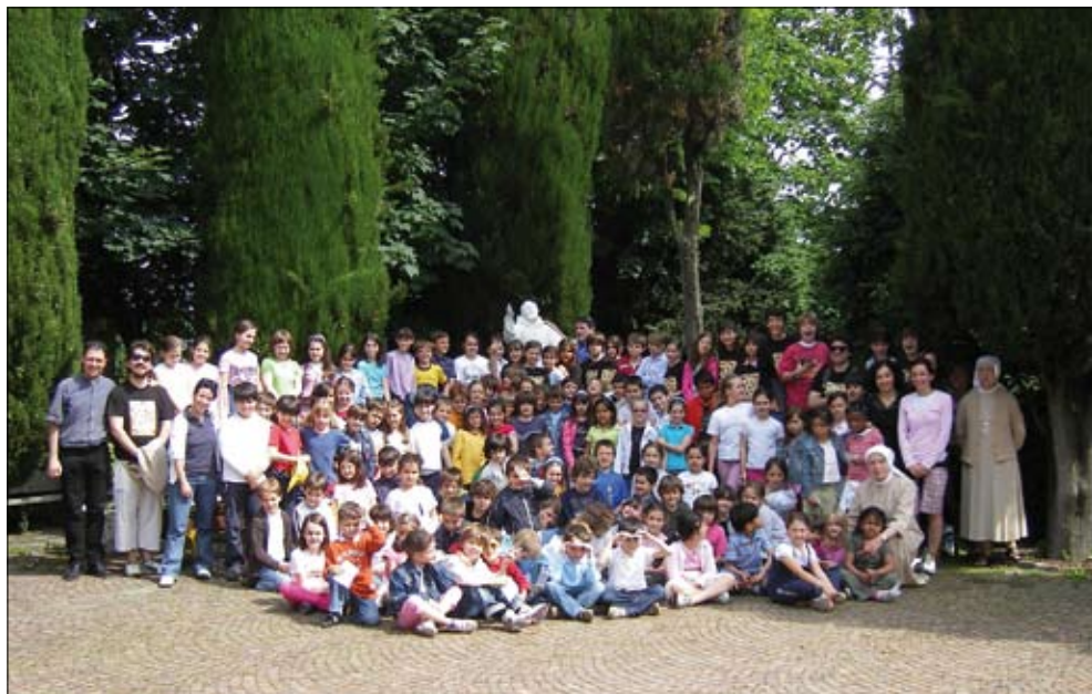
Pellegrinaggio dei bambini della scuola materna Figlie di Gesù di Modena