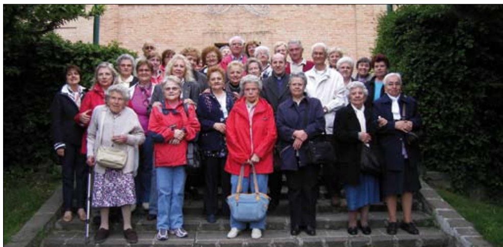
Pellegrinaggio dalla Parrocchia S. Giuseppe Cottolengo (Bologna)