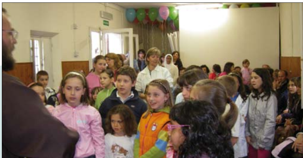
18 maggio (la terza domenica) - Consacrazione dei bambini alla Madonna